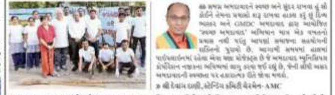
'સ્વચ્છ અમદાવાદ' મુંબેશને સફળ બનાવવા સ્વાનિક નાગરિકો અને દિવ્ય ભાસ્કરની દિમ સહી નજરે પડે છે.